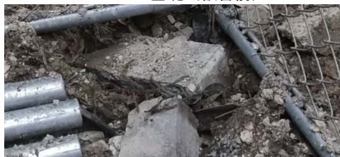
フェンス基礎（破損）