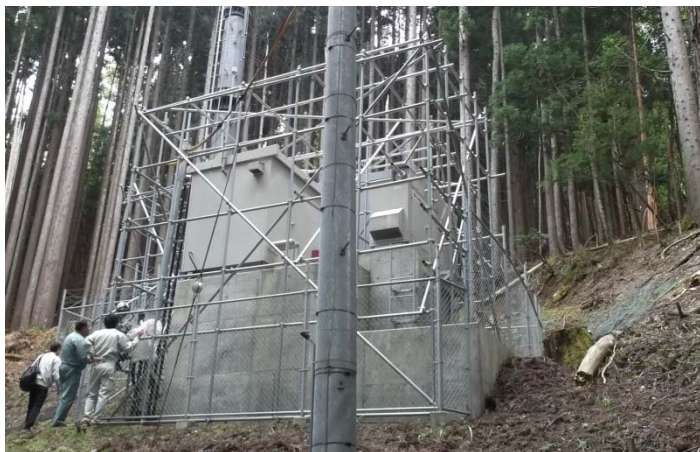
若桜前進基地局外観