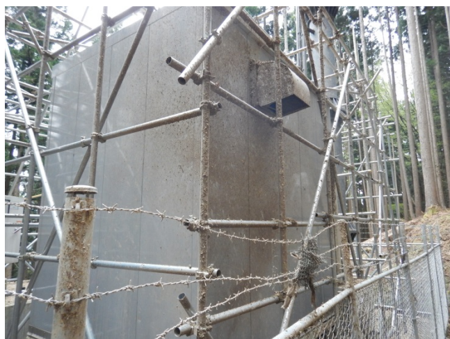
落雷の衝撃により付着した土砂、保護ネットの一部