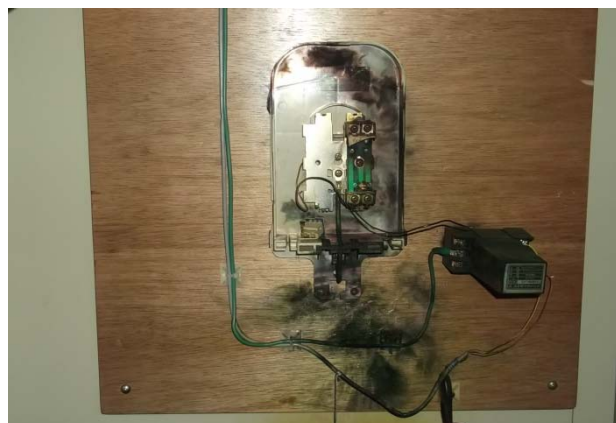
NTT 保安器と高速避雷器（破損）