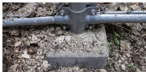
フェンス基礎（被害前）