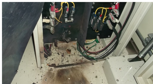
耐雷トランス（全損）