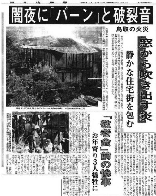
日本海新聞 平成14年9月15日掲載

12月24日 交通事故 鳥取市伏野 乗用車2台とワゴン車の衝突事故 負傷者13人