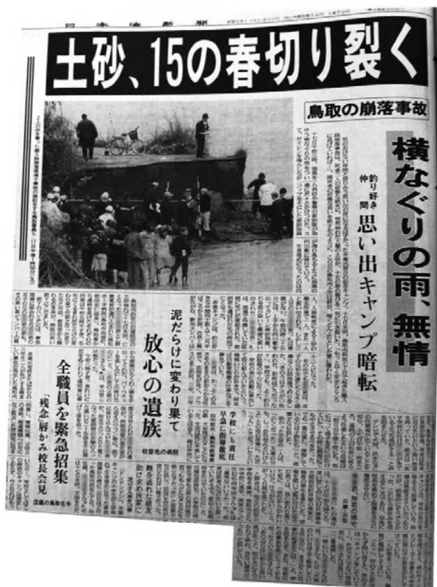
日本海新聞 平成8年3月18日掲載 鳥取県立図書館所蔵資料