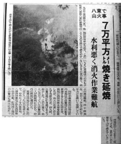
日本海新聞 平成6年8月10日掲載 鳥取県立図書館所蔵資料