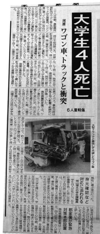
日本海新聞 平成9年6月28日掲載 鳥取県立図書館所蔵資料