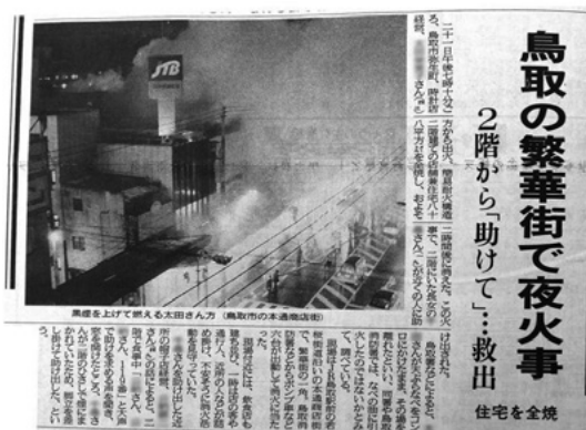
日本海新聞 平成5年1月22日掲載 鳥取県立図書館所蔵資料

3月28日 集団事故 八頭郡若桜町須澄 観光バスと普通乗用車の衝突 負傷者21名