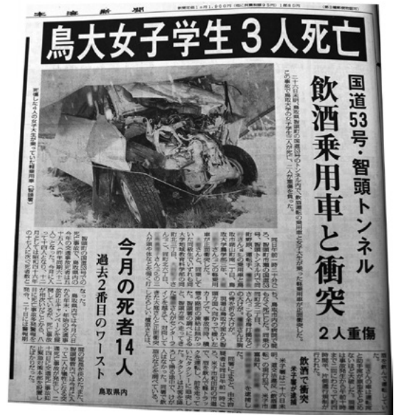
日本海新聞 平成11年12月27日掲載 鳥取県立図書館所蔵資料