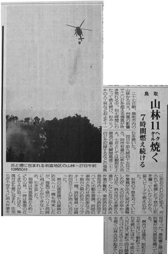
日本海新聞 平成11年7月28日掲載 鳥取県立図書館所蔵資料