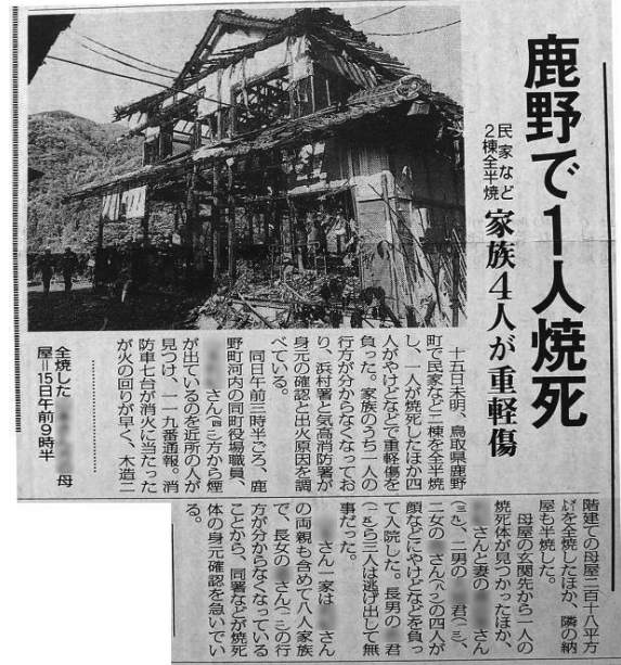
日本海新聞 平成10年11月16日掲載 鳥取県立図書館所蔵資料