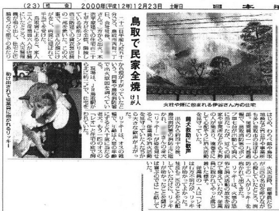
日本海新聞 平成12年12月23日掲載 鳥取県立図書館所蔵資料