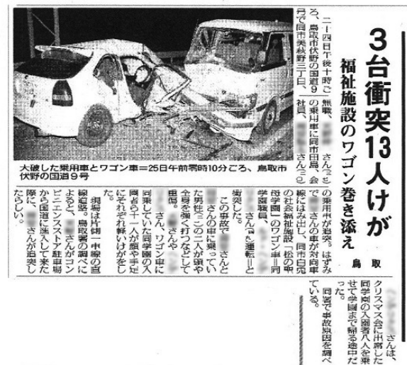
日本海新聞 平成14年12月26日掲載