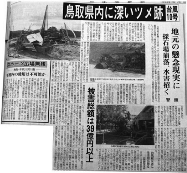
日本海新聞 平成10年10月20日掲載