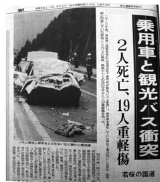
日本海新聞 平成5年3月29日掲載 鳥取県立図書館所蔵資料