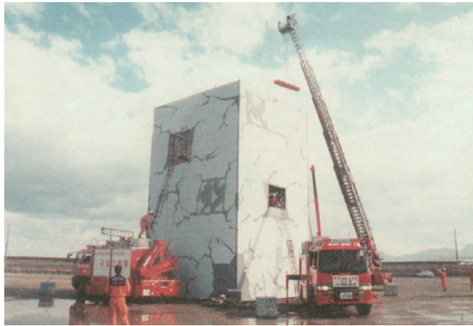
平成11年中国ブロック緊急消防援助隊合同訓練