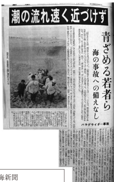
日本海新聞 平成6年10月30日掲載 鳥取県立図書館所蔵資料