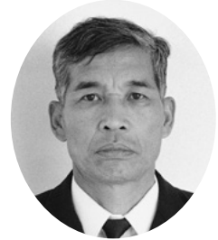
10代消防局長 近藤征之助氏