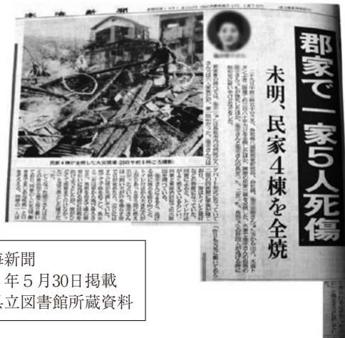
日本海新聞 平成4年5月30日掲載 鳥取県立図書館所蔵資料