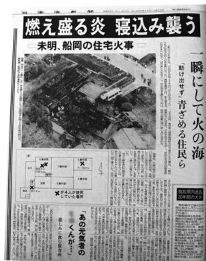
日本海新聞 平成6年11月6日掲載 鳥取県立図書館所蔵資料