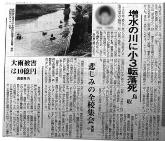
日本海新聞 平成9年7月15日掲載 鳥取県立図書館所蔵資料