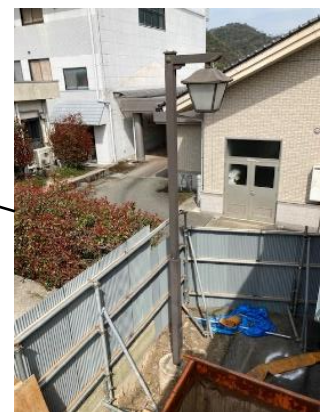
【移設予定の既設外灯】

本建設工事において、雨水排水用側溝の設置に既設外灯が支障となるため、影響がない隣接箇所に移設するとともに、ケーブルの埋設位置を変更する。