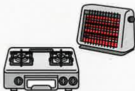
①火災の発生を防ぐために、ストーブやこんろ等は安全装置の付いた機器を使用する