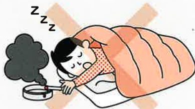
①寝たばこは絶対にしない、させない