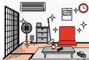
③火災の拡大を防ぐために、部屋を整理整頓し、寝具、衣類及びカーテンは、防災品を使用する