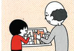
⑤お年寄りや身体の不自由な人は、避難経路と避難方法を常に確保し、備えておく