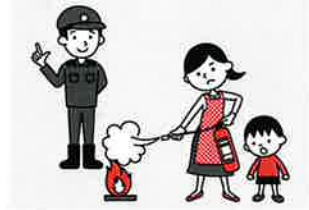
⑥防火防災訓練への参加、戸別訪問などにより、地域ぐるみの防火対策を行う