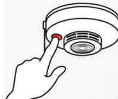
②火災の早期発見のために、住宅用火災警報器を定期的に点検し、10年を目安に交換する