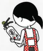
④火災を小さいうちに消すために、消火器等を設置し、使い方を確認しておく