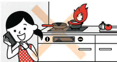
③こんろを使うときは火のそばを離れない