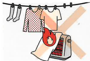
②ストーブの周りに燃えやすいものを置かない