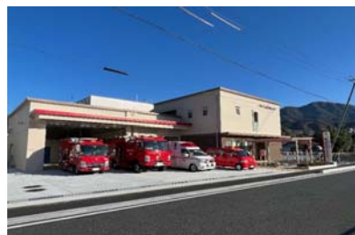
八頭消防署用瀬出張所 R4.12.8 開設