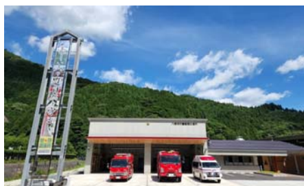
八頭消防署智頭出張所 R4.3.24 開設