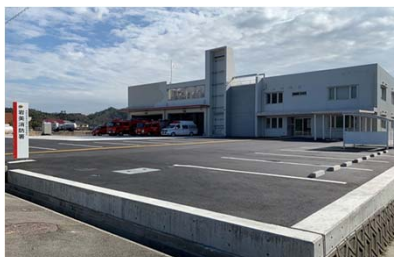
岩美消防署 H31.3.28 開設