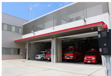
鳥取消防署東町出張所 H28.3.24 開設