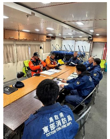
【県大隊引継ぎの様子】