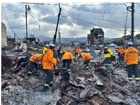
【河井町：火災現場での搜索活動】