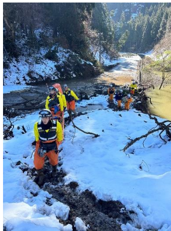
【空熊町：孤立集落からの救出活動】