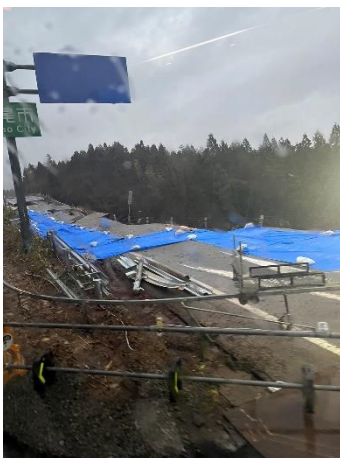
【のと里山海道の様子】