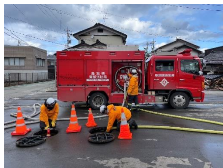
【輪島市：貯水槽への補水活動】