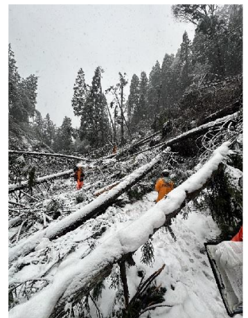
【打越町：孤立集落の搜索】