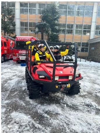
【空熊町：孤立集落への進出】